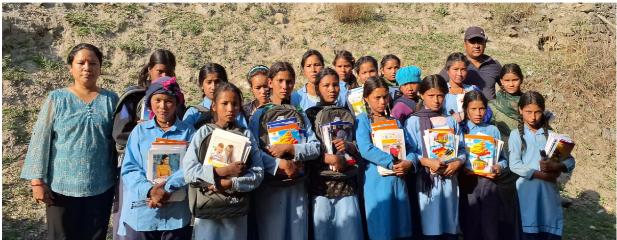
Gruppenbilder mit Patenkindern in Humla.