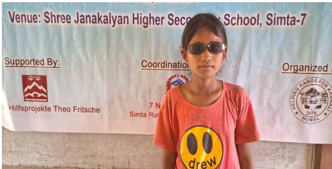
Ein Mädchen mit Sonnenbrille nach der Behandlung