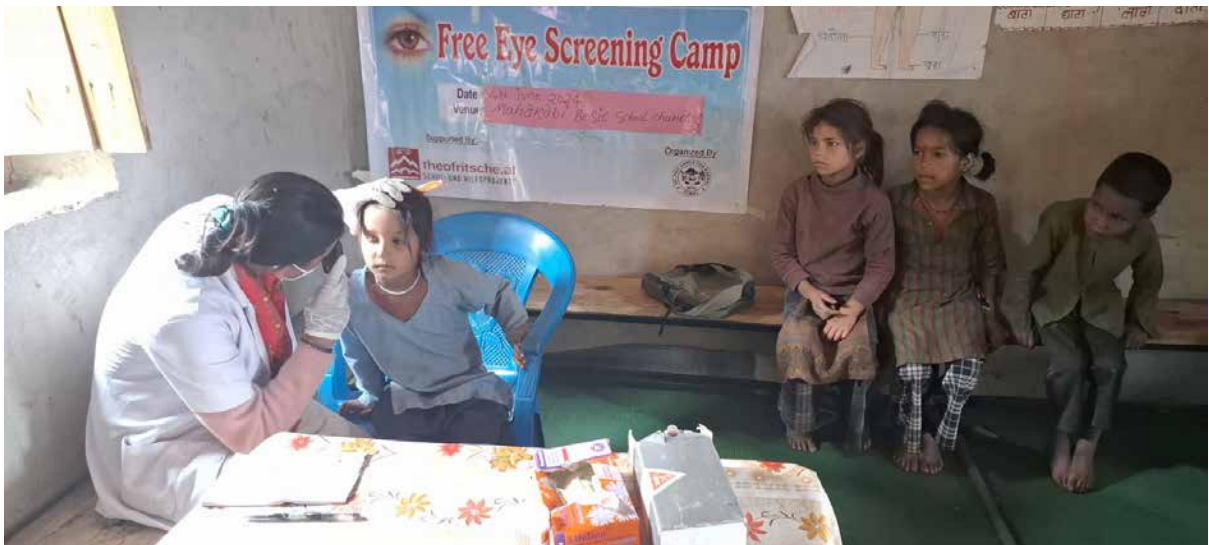
Kinder warten darauf, das Auge zu testen.