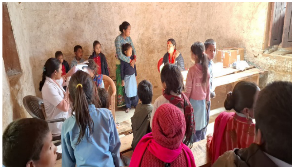
Hier sind einige Einblicke in das Augenscreening-Programm, das an verschiedenen Schulen durchgeführt wird