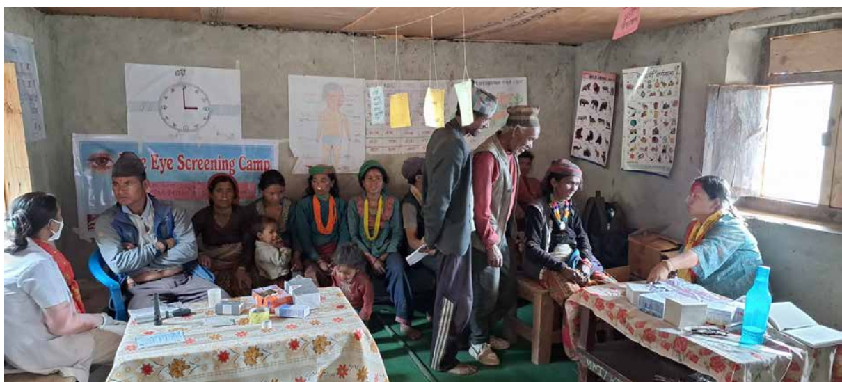
Hier stehen die Eltern der Kinder in der Leitung, um das Auge zu untersuchen.