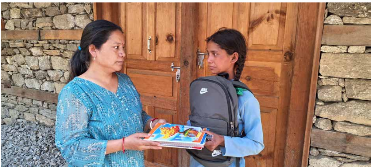
Einblicke in Bilder mit regulären Patenkindern zur Bildungsförderung in verschiedenen Schulen.